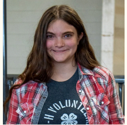
Submitted by Elosia Capraro, 4-H Council Reporter

Tendremos muchos artículos maravillosos para nuestra Subasta Silenciosa. La mayoría de los clubes han regalado una canasta con el tema "Pasaporte alrededor del mundo".